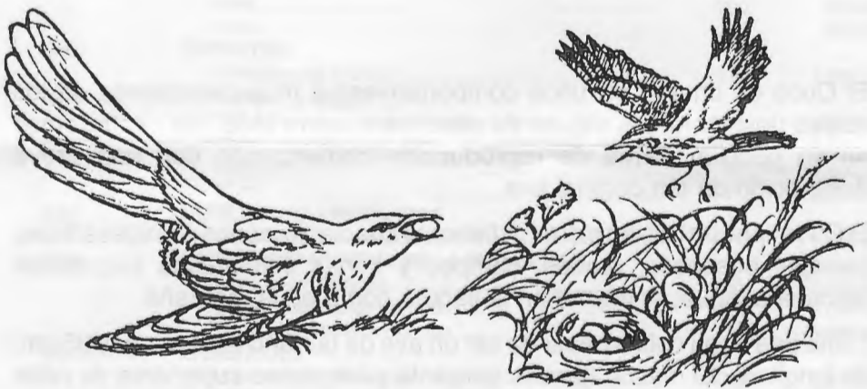
Cuco depositando su huevo en un nido de Bisbita ribereño

La hembra del Cuco tiene una forma muy personal y curiosa de colocar su huevo para que lo saquen adelante otros. El huevo es introducido en el nido ajeno con todas las artimañas posibles, primero busca y descubre el nido ajeno, observa a sus propietarios y después en un momento de distracción de éstos, les deposita su huevo en el nido, pero puede suceder que no se distraigan y entonces solicita la colaboración del macho de turno, el cual se encarga de desviar del nido a sus propietarios, pues el