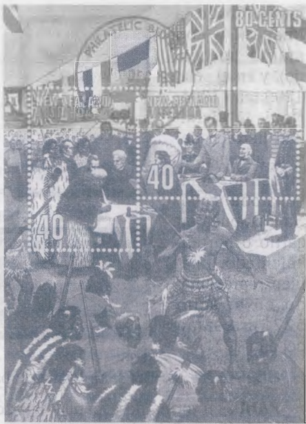
150th ANNIVERSARY OF THE TREATY OF WAITANGI 1840-1990 TE RAU, RIMA TEKAU TAU O TE TIRITI O WAITANGI 1840-1990

Moharra de madera tallada, enmangada con bejuco engalanado de plumas en un asta cilíndrica que se va aplanando hacia la base hasta convertirse en una espátula alargada. Figura en la hoja-bloque 72 (año 1990), Tratado de Waitangi, en manos del personaje central, un jefe enardeciendo a sus guerreros que blande la lanza en todas direcciones mientras gesticula; también la empuña el maorí que figura de espaldas en primer término, con un manto rayado. Es el modelo más difundido; figuraba en el escudo nacional anglo neozelandés de 1911; aparece en el sello 1450 (año 1996) y en el 1598 (año 1998).