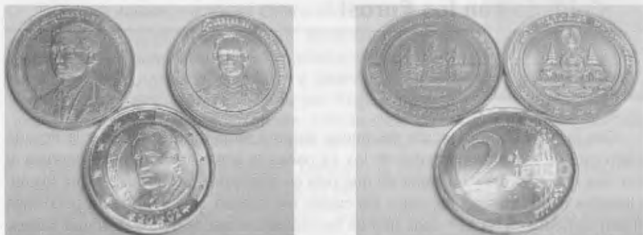
Una moneda de dos €uros españoles con dos monedas de 10 bahts de Tailandia.

Por otra parte y como curiosidad, en la foto nº 3 se puede ver el anverso y reverso de una moneda de un €uro español a la que le falta parte del metal de la parte interna, puede ser debido a haber utilizado el extremo de la pieza de metal o a haber dado dos golpes el troquel que realiza el círculo interior. Podemos decir que esta moneda bien vale algo menos de un €uro, por lo menos en su peso, pues sería rechazada por todas las máquinas expendedoras.